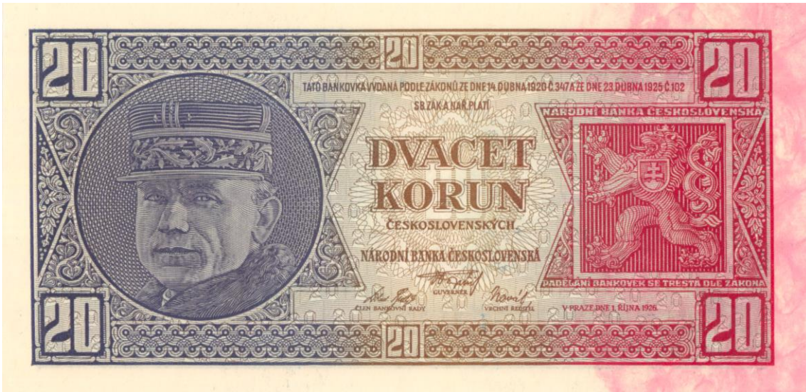
První bankovka NBC – 20 Kč vzor 1926 (líc)