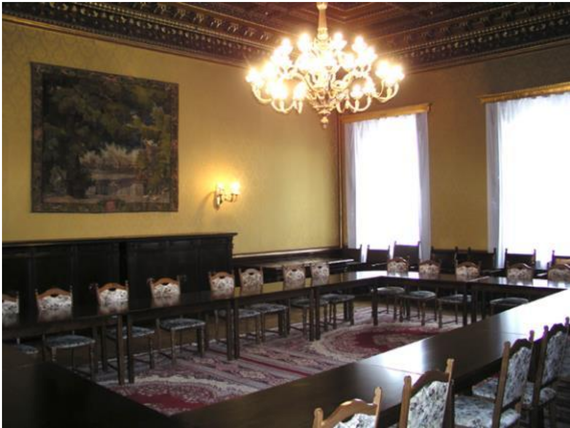
Zasedací místnost bankovní rady