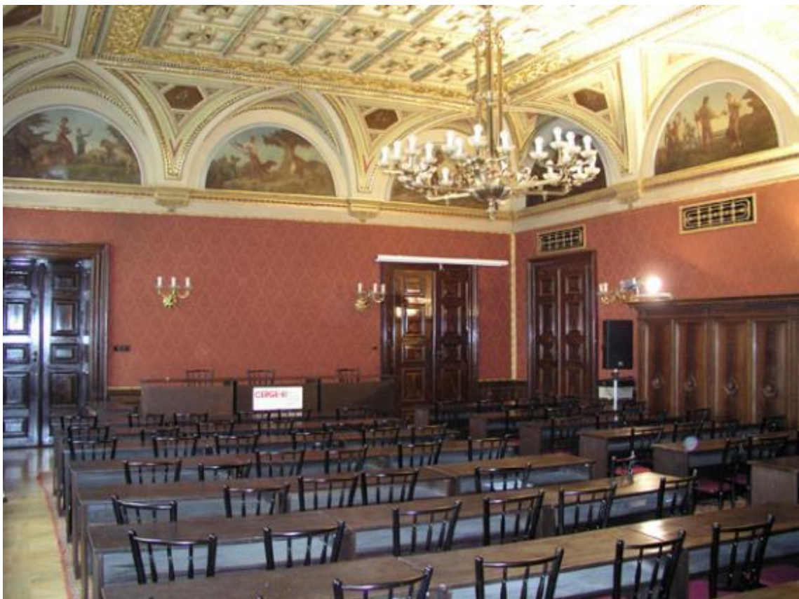
Předsíň zasedací místnosti bankovní rady