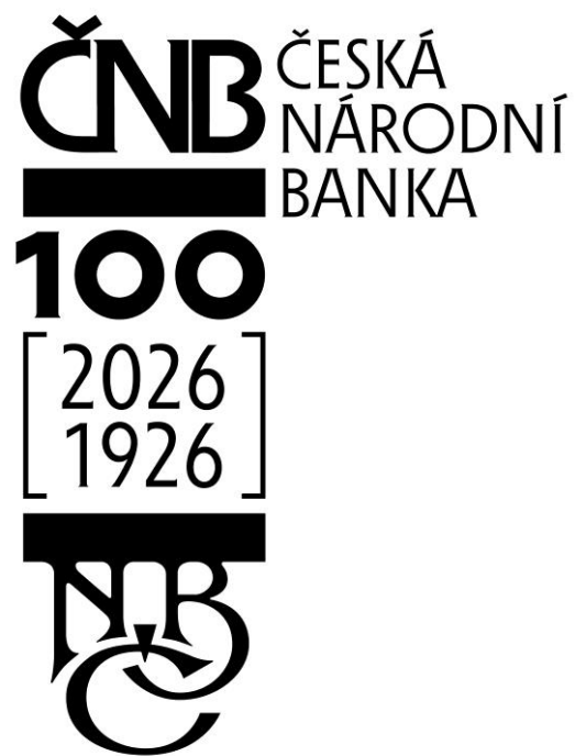
Základní a slavnostní logotyp ČNB k 100. výročí založení NBČ