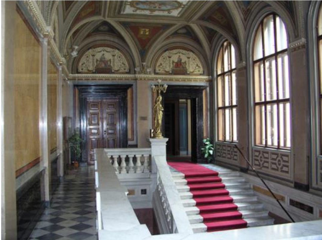
Hlavní schodiště v někdejší budově NBČ