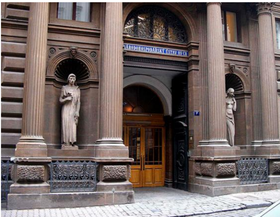
Průčelí někdejší budovy NBC – tehdejší Bredovská ulice, dnes Národohospodářský ústav