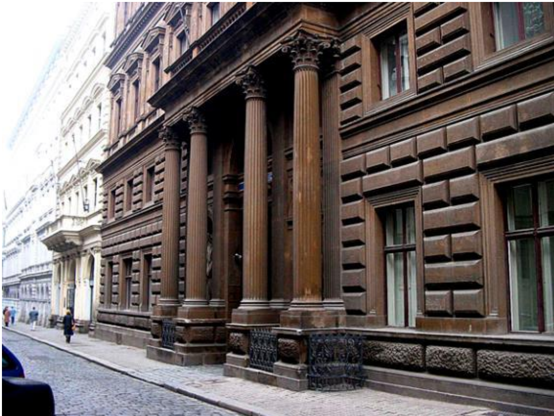
Někdejší budova NBC – tehdejší Bredovská ulice