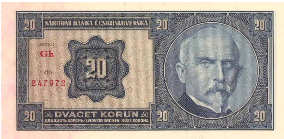
První bankovka NBC – 20 Kč vzor 1926 (rub)