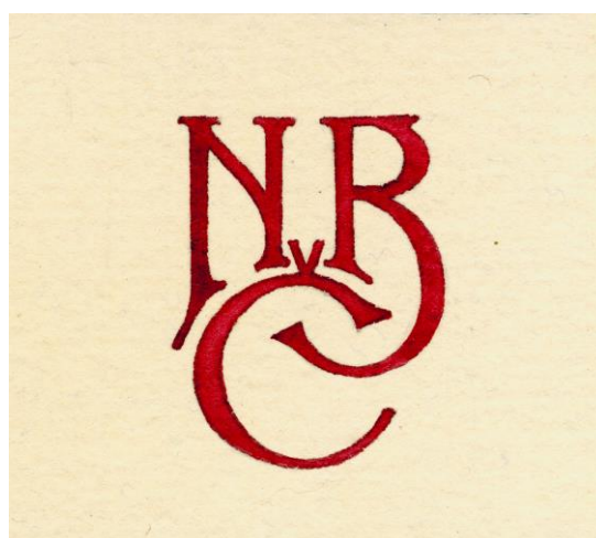
Dobové emblémy NBČ