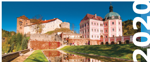
Bečov nad Teplou