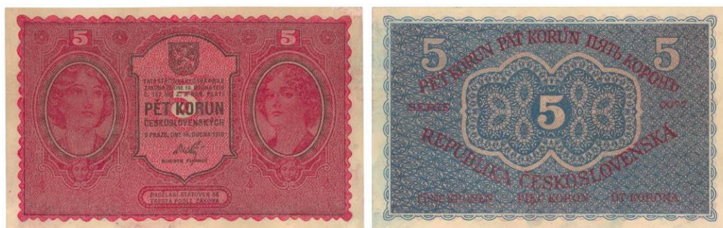
5 Kč, líc a rub