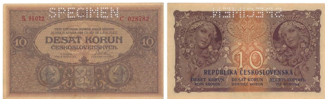
10 Kč, líc a rub