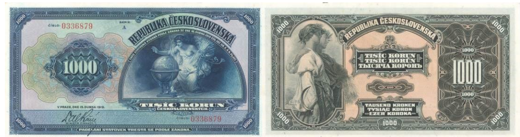
1 000 Kč, líc a rub