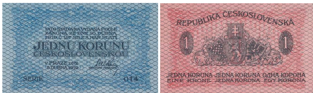
1 Kč, líc a rub