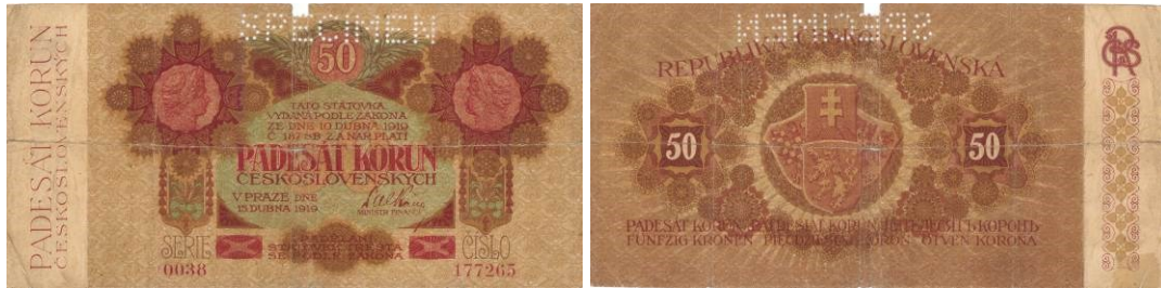
50 Kč, líc a rub