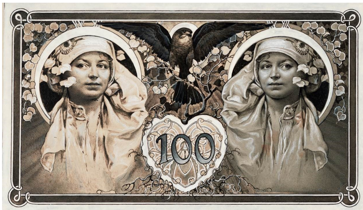
Původní výtvarné návrhy Alfonse Muchy na líc a rub.