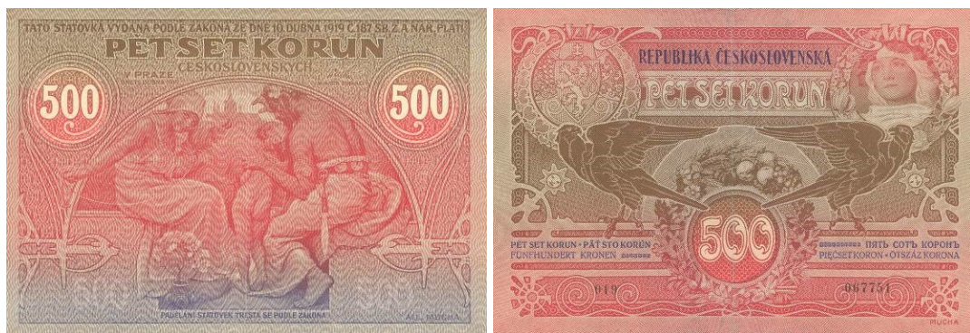
500 Kč, líc a rub