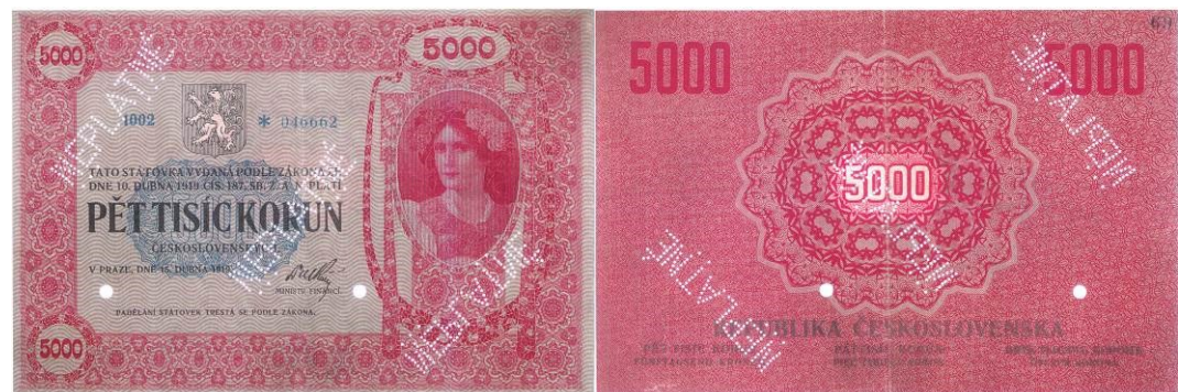
5 000 Kč, líc a rub