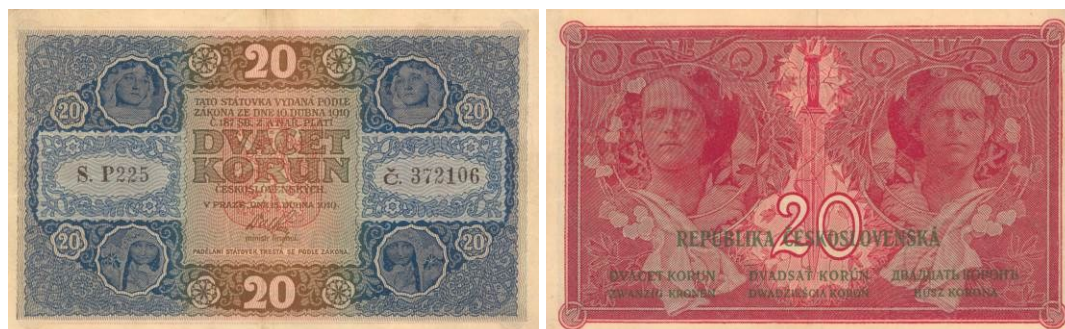
20 Kč, líc a rub