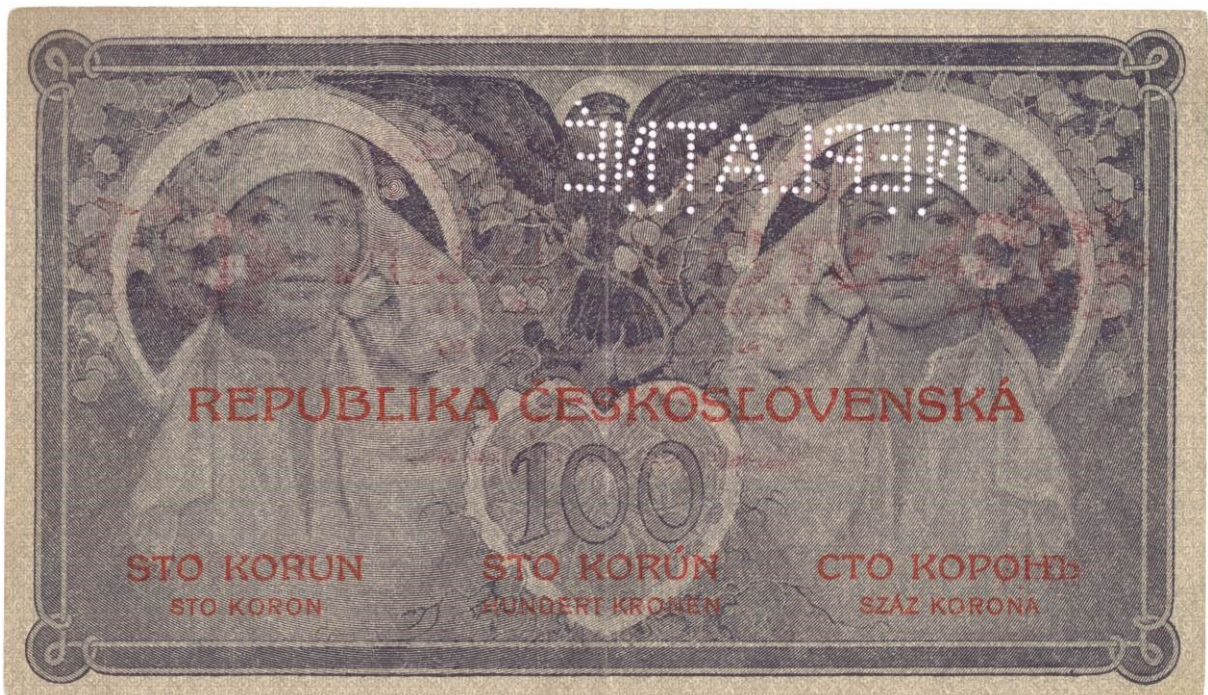
Líc a rub v konečném tiskovém provedení.