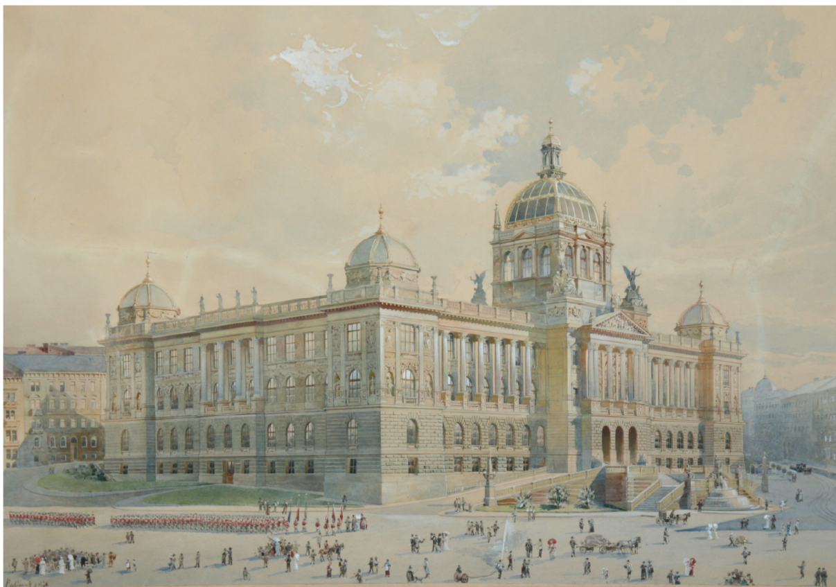
Historická budova Národního muzea