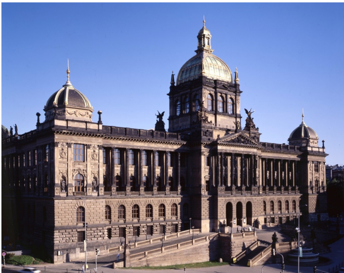
Historická budova Národního muzea