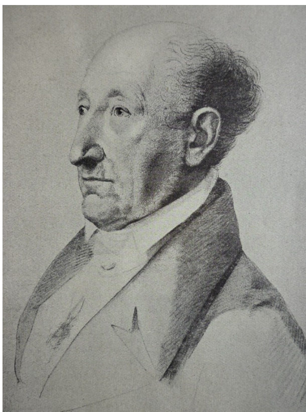
hrabě Kašpar Maria Sternberk