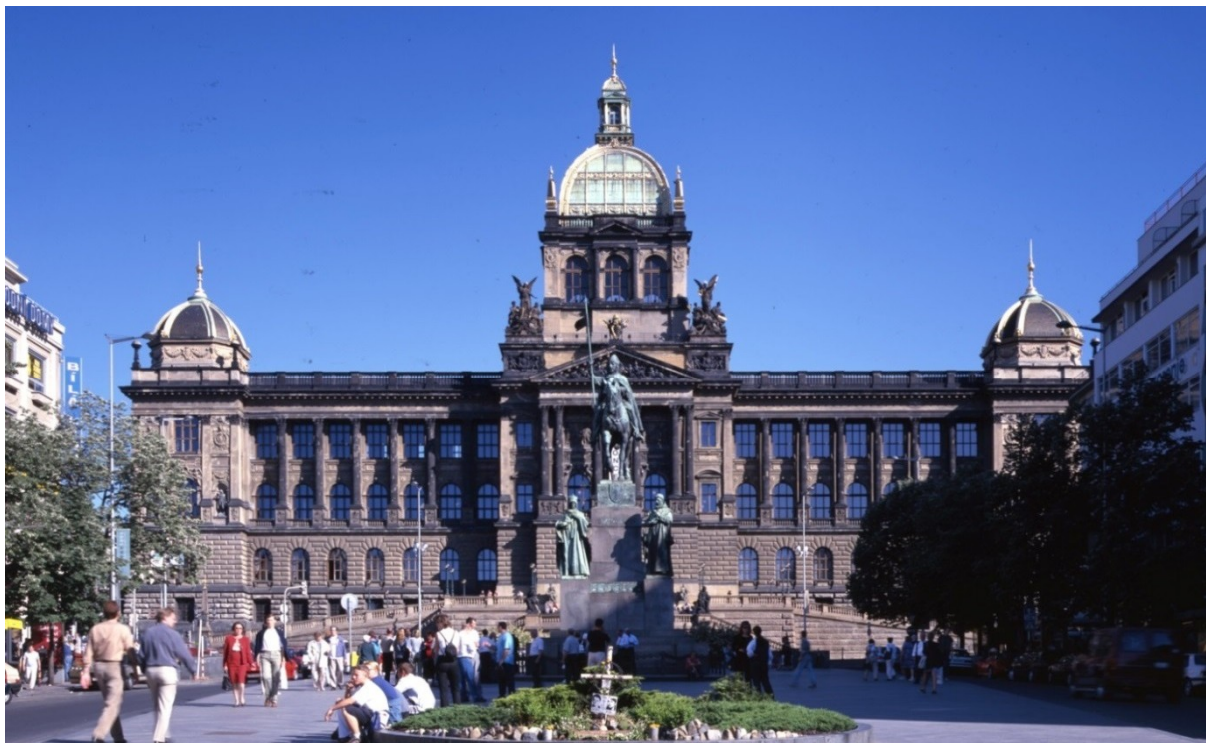
Historická budova Národního muzea