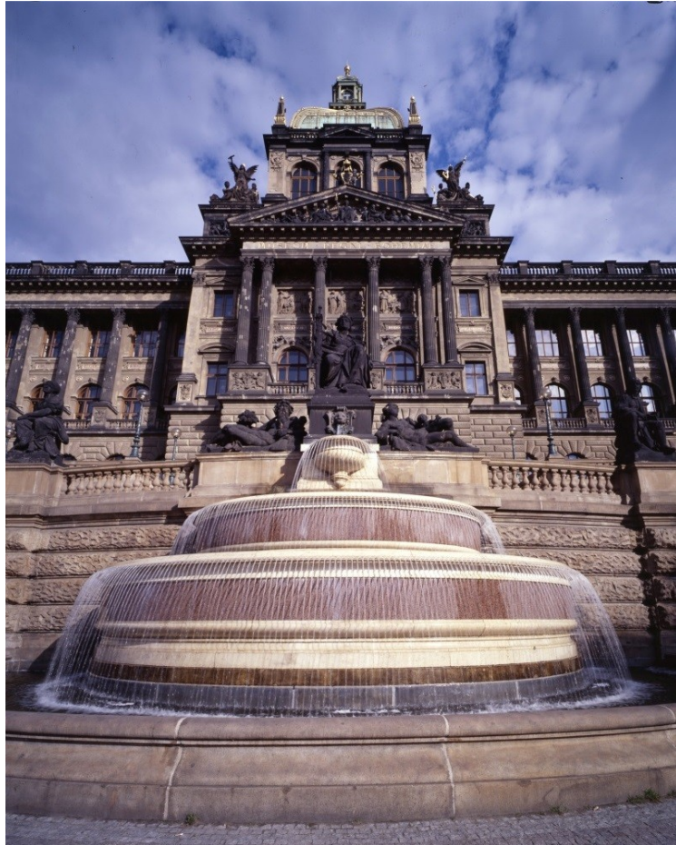
Historická budova Národního muzea