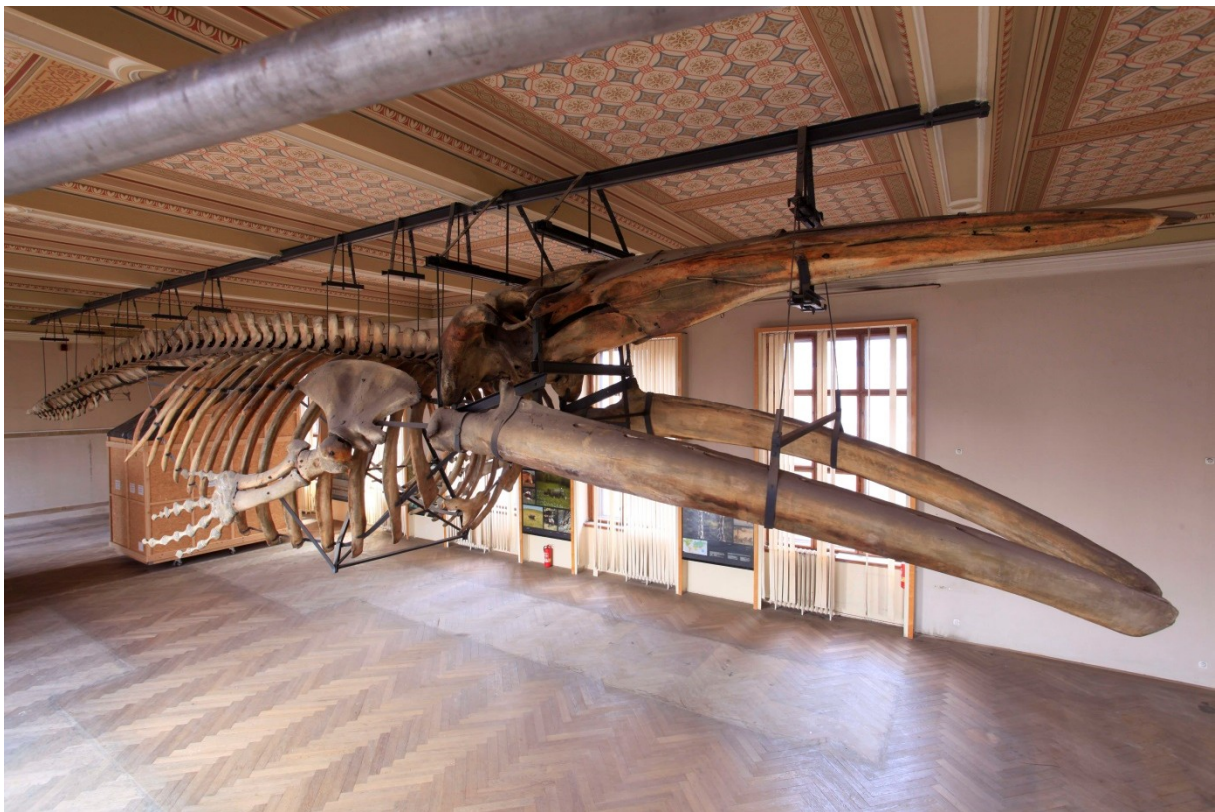
Kostra plejtváka myšoka