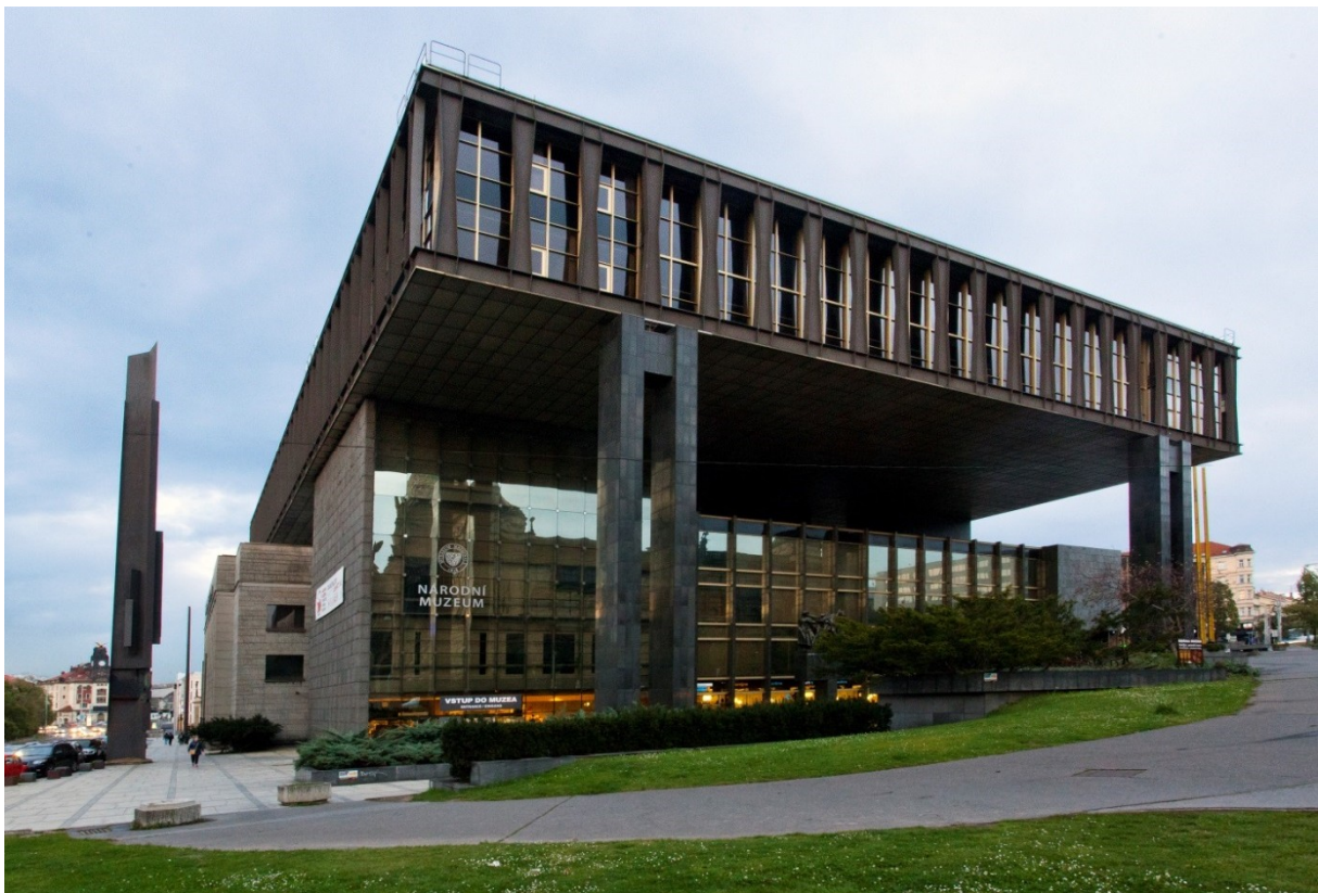
Nová budova Národního muzea