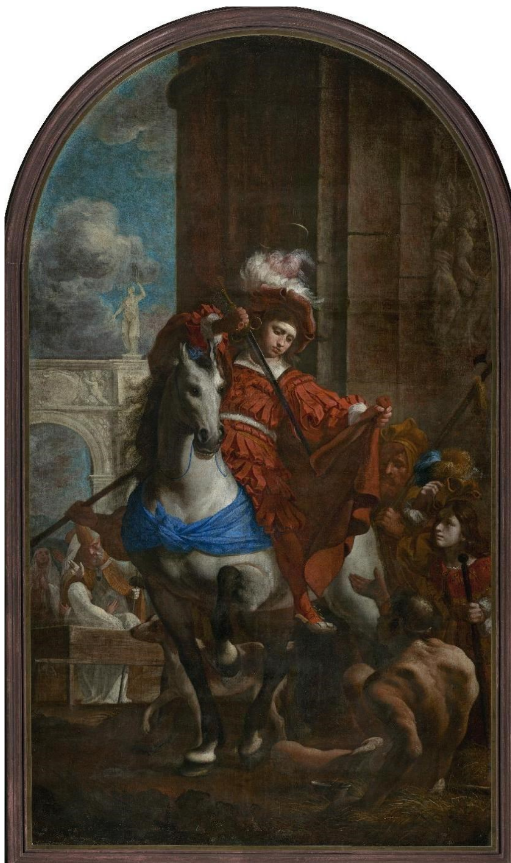
Karel Škréta, Sv. Martin se dělí se žebřákem o plášť, kolem 1650, olej, plátno, Národní galerie Praha